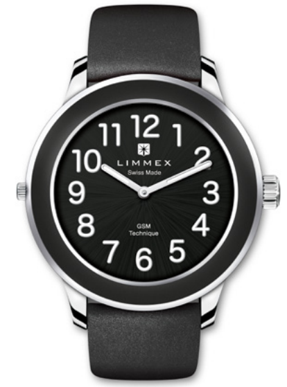
Liberty 02 | mit Silikonarmband