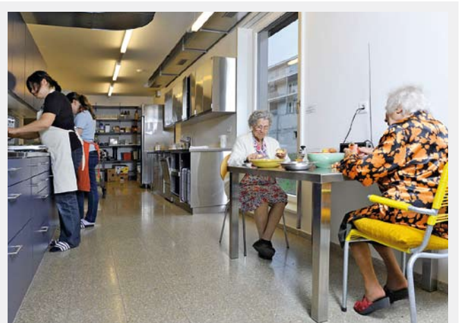
Rüstig und rüstend in der Küche der Pflegewohngruppe – vorhandene Ressourcen werden gebraucht – auch für die Gemeinschaft.

In den Wohnungen des Zentrums lebt man möglichst lange eigenverantwortlich und eigenständig. Vorhandene Ressourcen sollen gebraucht werden. Man muss nur beziehen, was man wünscht und braucht. Wenn gewisse Angebote nur wenig genutzt werden, muss man das als Anbieter aushalten und Geduld haben. Denn wenn Unterstützung plötzlich nötig wird, dann ist das Angebot vorhanden. Das vermittelt den alternden Mieterinnen und Mietern Sicherheit.