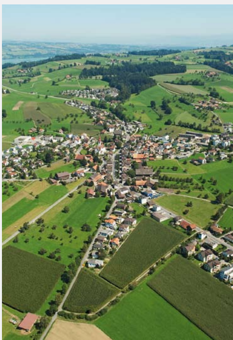
Die Gemeinde Buttisholz – ein ländliches, aber verkehrstechnisch gut erschlossenes Dorf.

Das neue Altersleitbild, das durch eine Arbeitsgruppe sorgfältig entwickelt wurde, trug dieser Situation in seinem Massnahmenkatalog Rechnung: An guter Lage sollte ein Wohnzentrum entstehen, das alternen Personen Wohnraum bietet, der sich an den individuellen Bedürfnissen orientiert. Mit einem Mix aus verschiedenen Wohnformen sollten Wohnmöglichkeiten bis zum Lebensende geboten werden: vom autonomen Haushalt über das Wohnen mit modularen Dienstleistungen bis zum be-