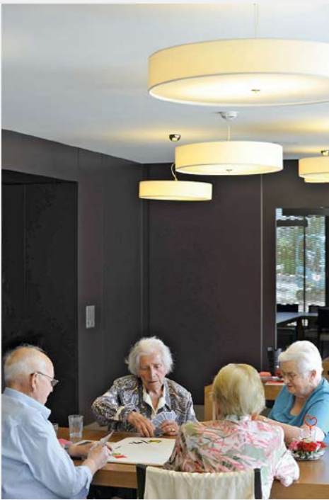
Abbildung oben: Ort der Begegnung – die Cafeteria des Vereins Pflege-wohngruppen ist das soziale Herz des Wohnzentrums.

Die Mieterschaft von Haus A ist mehrheitlich zwischen siebzig und neunzig Jahre alt und rüstig. Obwohl sie noch wenig Unterstützung im Alltag benötigen, sind viele wegen des Dienstleis-