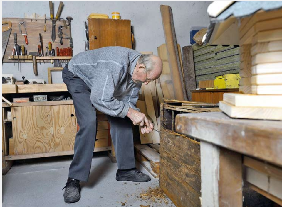
Abbildung rechts: Schreinerei im Wohnzentrum – man sucht nach Möglichkeiten und nicht nach Grenzen.

konzept des Wohnzentrums Primavera umgesetzt wird. Die Resultate beschreiben eine lebendige Wohnumwelt mit anpassungsfähigen Strukturen.