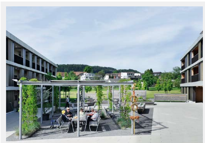
Das «Pärkli» – wer im Wohnzentrum Primavera zu Hause ist, nimmt am Dorfleben teil.

Mit der Cafeteria, dem Gemeinschaftsraum und dem attraktiven Hofplatz ist im Primavera ein zentraler Ort der Begegnung entstanden, an dem die betagten Bewohner des Wohnzent-