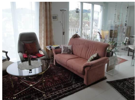
Blick in eine Alterswohnung