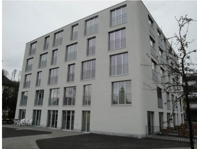
Alters- und Pflegewohnungen

Die Gemeinde Bärenswil im Zürcher-Oberland mit rund 4900 Einwohnern hatte bis Ende 2011 nur eine Alterssiedlung mit 24 Wohnungen, die den Bedarf an Alterswohnungen nicht mehr abzudecken vermochte. Auch das vor 50 Jahren diskutierte und als dringend notwendig erachtete Alters- od. Pflegeheim wurde immer wieder aus Kostengründen „schubladisiert“.