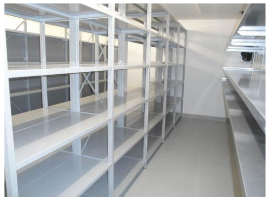
Archiv und Lager