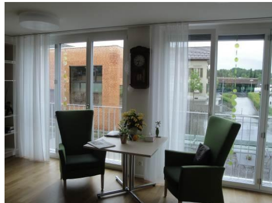
weiterer Aufenthaltsraum (in grün)