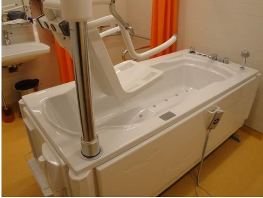
Pflegebad mit integriertem Lift