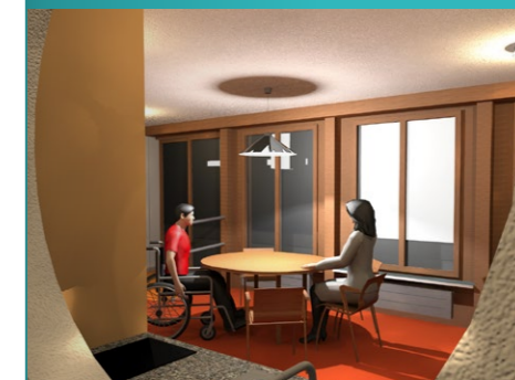
5 Bauprojekt 2024

Die Bauarbeiten sollen im Sommer/Herbst 2024 ausgeführt werden, sodass der Einzug der Aussenwohngruppe auf Anfang 2025 möglich sein wird und das Mietverhältnis für das Haus Freieck aufgelöst werden kann.