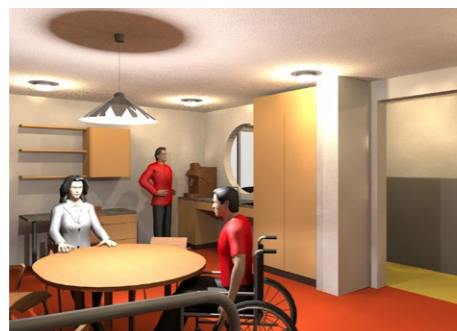
2 Bauprojekt 2024

Das Haus Freieck ist für körperlich eingeschränkte Menschen weniger geeignet und vermag mit zunehmendem Alter der Bewohnerinnen den Ansprüchen nicht mehr gerecht zu werden, insbesondere ist das mehrstöckige Gebäude nicht rollstuhlgängig und hat keinen Lift. Andererseits werden im Wohn- und Pflegeheim an der Hirschengutstrasse 22b im vierten Geschoss Räume frei, die nicht mehr von den Schönstätter Marienschwestern benutzt werden. Diese können mit einer baulichen Erneuerung und leichten Umgestaltung neu der Aussenwohngruppe dienen. Die Aussenwohngruppe wird soweit selbständig weitergeführt, kann aber die im Hauptgebäude vorhandene allgemeine Infrastruktur (Speisesaal, Atelier, usw.) mitbenützen und Dienstleistungen in Anspruch nehmen. Diese Lösung ist nachhaltig, betrieblich zweckmässig und finanziell optimal.